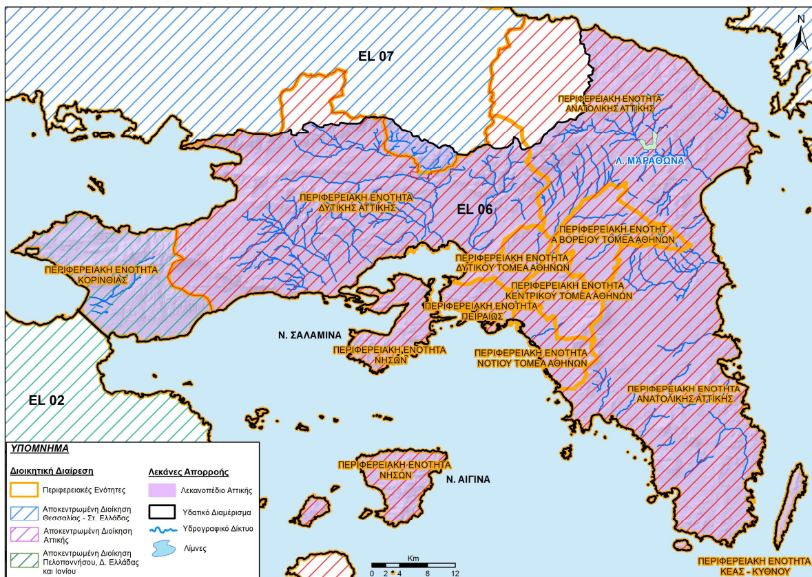
Σχήμα 3.1: Διοικητική Διαίρεση και Αρμόδιες Αρχές ΥΔ Αττικής