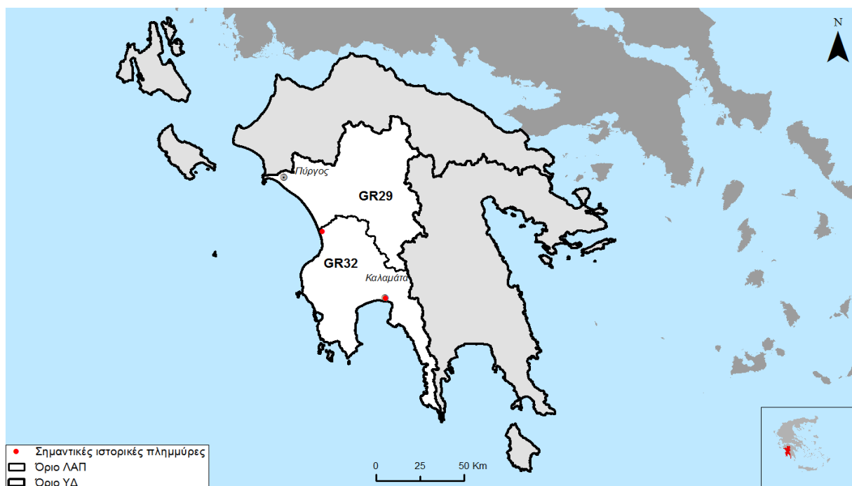
Σχήμα 2.1: Σημαντικές ιστορικές πλημμύρες ΥΔ Δυτικής Πελοποννήσου (GR01)

Όσα συμβάντα ανήκουν στις κατηγορίες "υψηλή" ή "πολύ υψηλή" χαρακτηρίζονται ως "σημαντικά" ιστορικά γεγονότα σύμφωνα με τα οριζόμενα στην Οδηγία 2007/60/ΕΚ και στην Κοινή Υπουργική Απόφαση (Κ.Υ.Α.) Η.Π. 31822/1542/Ε103/2010 (ΦΕΚ 1108 Β'/21.07.2010) και με βάση αυτά, στην παρακάτω εικόνα παρουσιάζονται οι θέσεις των σημαντικών ιστορικών πλημμυρών για τα διάφορα υδατικά διαμερίσματα.