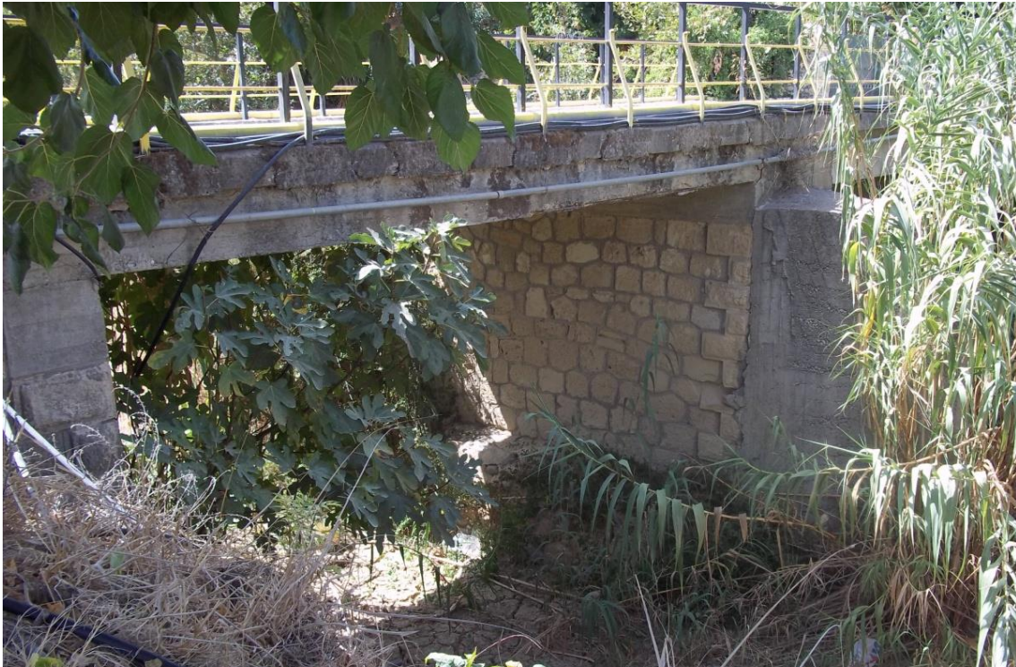
Φ 51: Χαρακτηριστικές φωτογραφίες οχετού στην περιοχή της Μεσσαράς της Π.Ε. Ηρακλείου (Κωδικός έργου: ΚΟΥΤΣΟΥΛΙΔΗΣ 3).