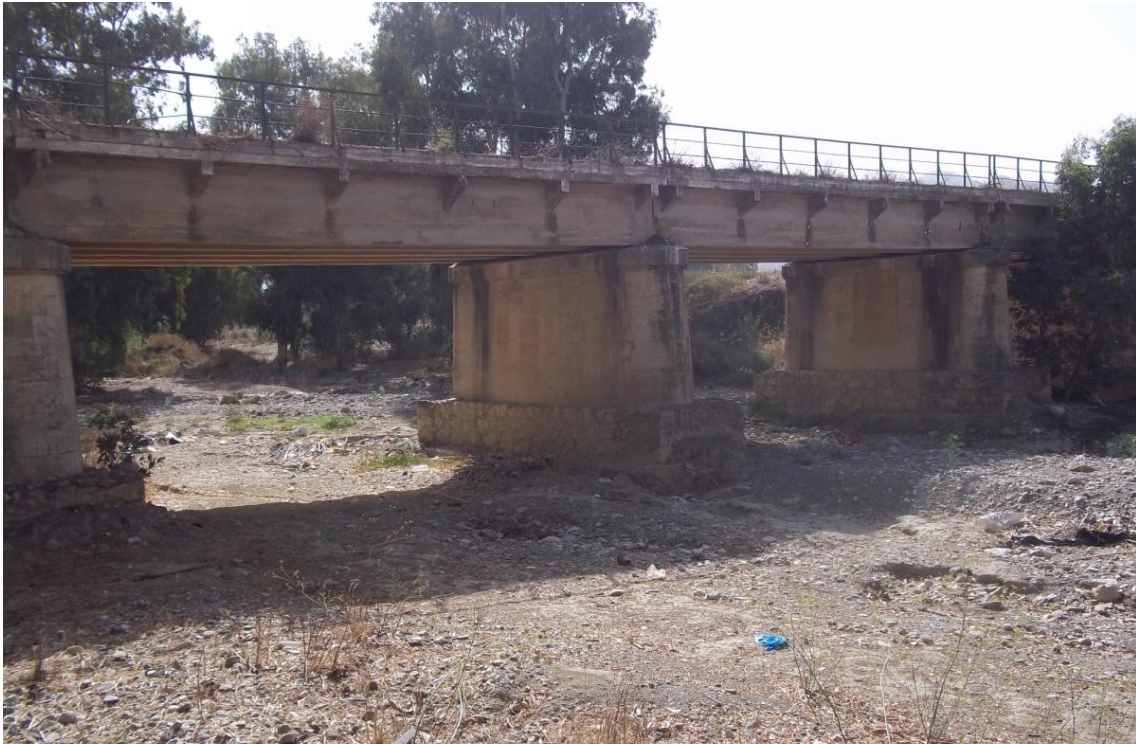
Φ 43: Χαρακτηριστικές φωτογραφίες αναβαθμού στην περιοχή της Μεσσαράς της Π.Ε. Ηρακλείου (Κωδικός έργου: ΓΕΡΟΠΟΤΑΜΟΣ 2).