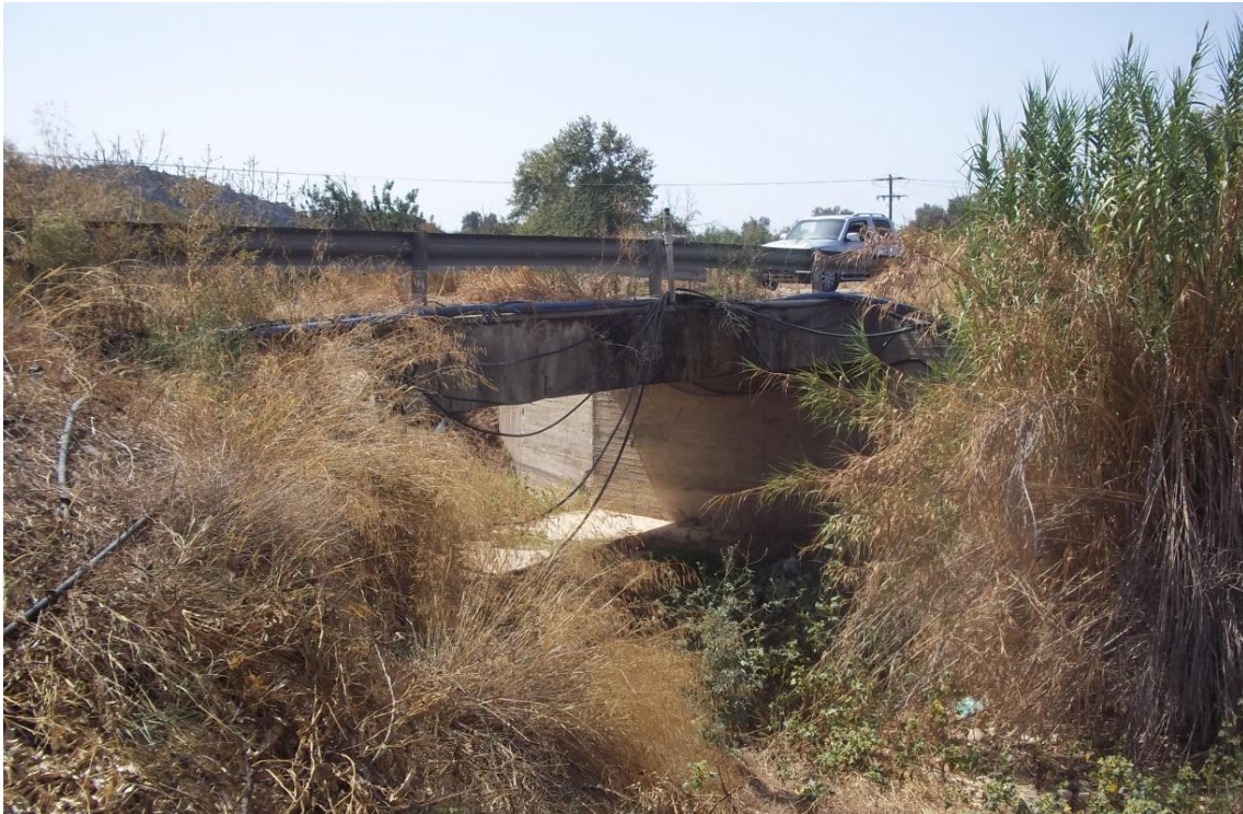
Φ 52: Χαρακτηριστικές φωτογραφίες οχετού στην περιοχή της Μεσσαράς της Π.Ε. Ηρακλείου (Κωδικός έργου: ΚΟΥΤΣΟΥΛΙΔΗΣ 4).