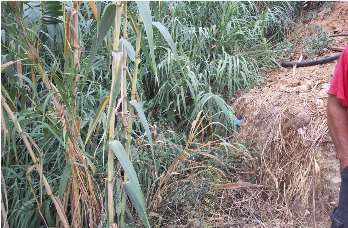
Φ 99: Χαρακτηριστικές φωτογραφίες πλακοσκεπή οχετού στην περιοχή Αγία Μαρίνα της Π.Ε. Χανίων (Κωδικός έργου: ΑΓ. ΜΑΡΙΝΑ 3).