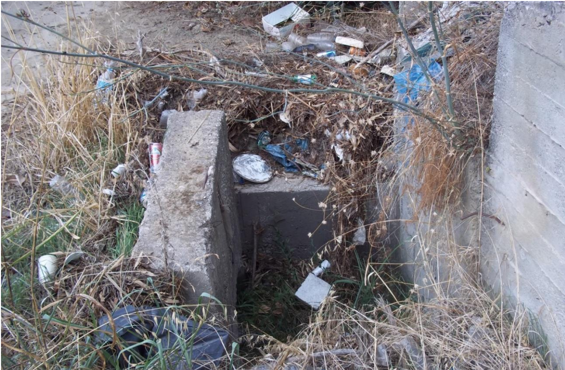
Φ 98: Χαρακτηριστικές φωτογραφίες πλακοσκεπή οχετού στην περιοχή Αγία Μαρίνα της Π.Ε. Χανίων (Κωδικός έργου: ΑΓ. ΜΑΡΙΝΑ 2).