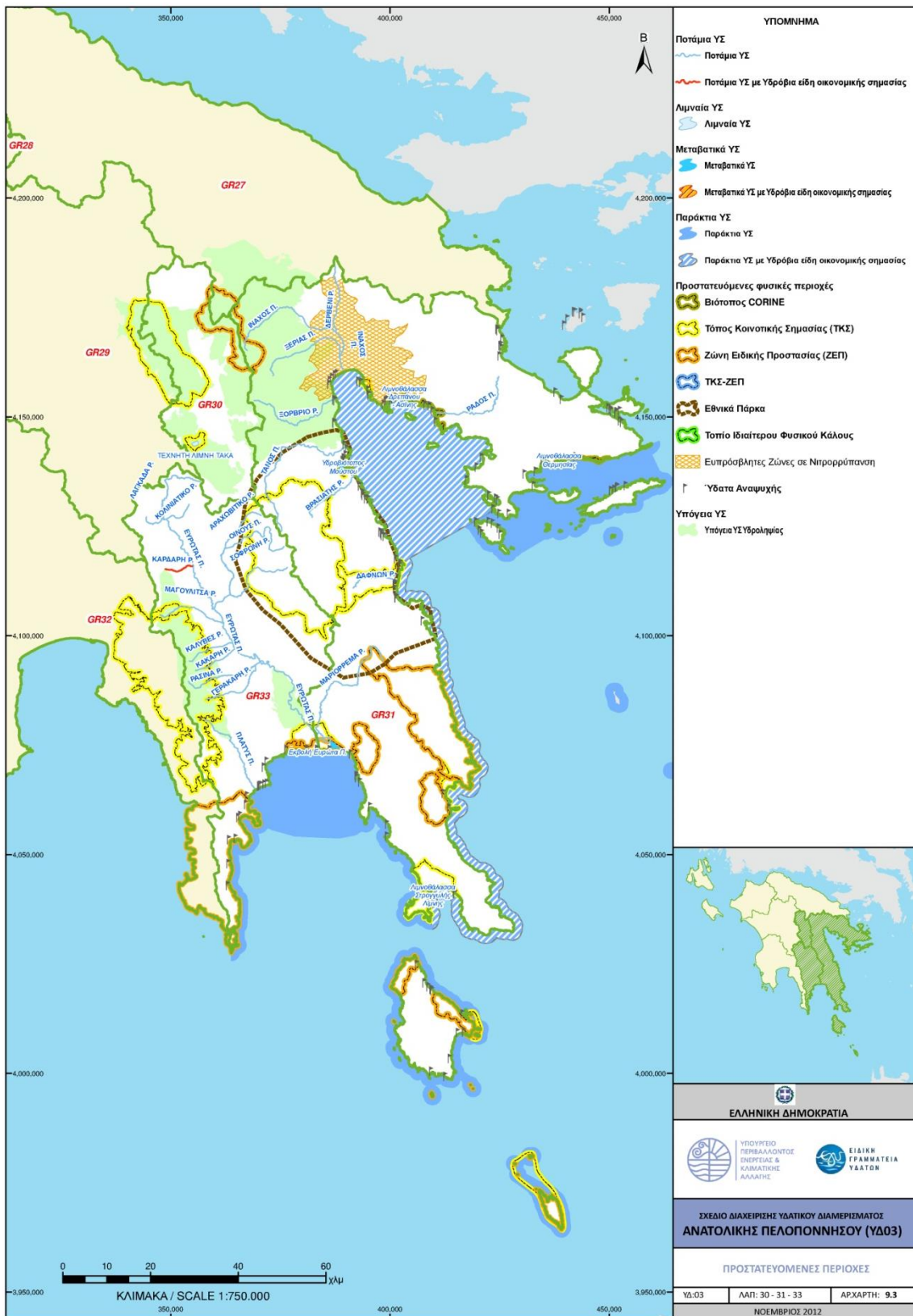
Σχήμα 3.1: Προστατευόμενες περιοχές Οδηγίας 2000/60/ΕΚ ΥΔ 03