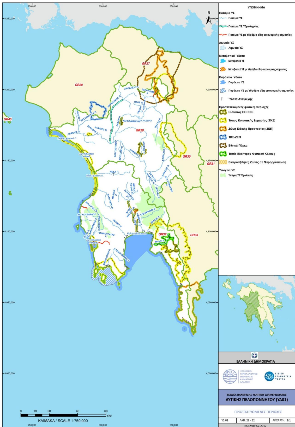
Σχήμα 3.1: Προστατευόμενες περιοχές Οδηγίας 2000/60/ΕΚ ΥΔ 01